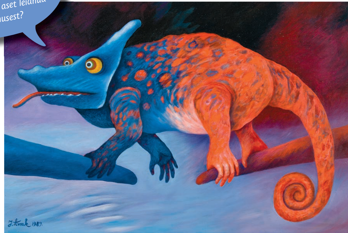
JURI ARAK. KAMEELEONI JALUTUSKÄIK. 1989. EESTI KUNSTIMUUSEUM

KAS TEADSID, et iga ajaloopilt räägib rohkem oma loomisajast kui tegelikult aset leidnud sündmusest?