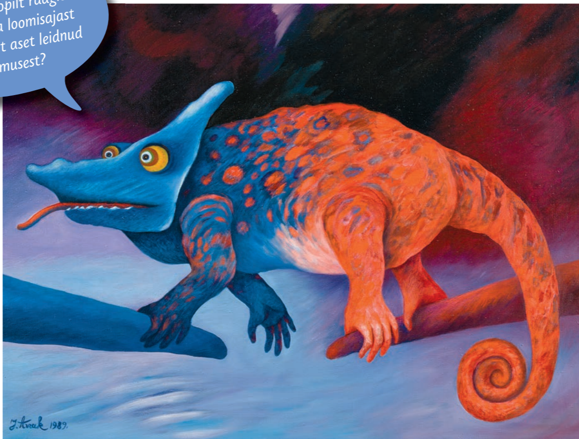
JÜRI ARRAK. KAMEELEONI JALUTUSKÄIK. 1989. EESTI KUNSTIMUSEUM

KAS TEADSID, et iga ajaloopilt räägib rohkem oma loomisajast kui tegelikult aset leidnud sündmusest?